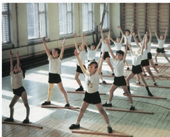
Урок гимнастики в общеобразовательной средней школе.

ситуации, когда нежелание руководства страны найти дипломатический компромисс между политическим курсом партии и конкретным спортивным состязанием приводило к драматическим последствиям для ведущих советских спортсменов. Среди наиболее известных примеров – отказ мужской сборной команды СССР по баскетболу играть решающий матч чемпионата мира со сборной Тайваня (1959), что лишило её возможности впервые стать чемпионом мира; отказ сборной команды СССР по футболу играть отборочный матч с командой Чили в Сантьяго после военного переворота (1973), что автоматически лишило её возможности участвовать в чемпионате мира в ФРГ (1974); отказ от участия в Олимпиаде в Лос-Анджелесе (1984) всей национальной олимпийской команды СССР, и др.