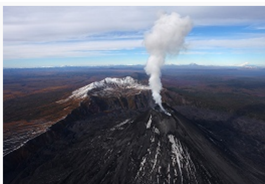
Парогазовая активность вулкана Карымская Сопка (Центральная Камчатка, 21 сентября 2010).

вулканов (Ключевская Сопка – 1944–45, 1994; Авачинская Сопка – 1926, 1945; Шивелуч – 1964, 2001; Тятя – 1973; Алаид – 1981, и особенно Безымянный – 1956) формировались эруптивные тучи из смеси большого количества мелких обломков лав, вулканического пепла, газов, поднимавшиеся в стратосферу до высоты 45 км. Выделение SO 2 , CO 2 , H 2 O и HCl при извержениях вулканов Камчатско-Курильского региона даёт ок. 10% эмиссии газов всех действующих вулканов мира. Установлена чёткая корреляция между мощными взрывными извержениями вулканов в этом районе и т. н. кислотными пиками в разрезах ледников, связанными с воздействием вулканических аэрозолей (т. к. пики датируются временем, когда отсутствовала техногенная составляющая в формировании загрязнения окружающей среды). Как правило, вслед за крупными эксплозивными извержениями наступало кратковременное похолодание (на 0,4–0,5 °С) на поверхности Земли. Действующие здесь вулканы проходят в своём развитии две стадии. Первая (продолжительностью от первых сотен до 10–12 тыс. лет) отличается сильной вулканической активностью: увеличением объёма изверженных продуктов, ростом вулкана и др.; вторая стадия (10–50 тыс. лет) характеризуется ослаблением вулканической деятельности и разрушением эруптивной постройки. Подавляющее большинство действующих вулканов региона находится в 1-й стадии, при этом их деятельность характеризуется сильными эффузивными и эксплозивными извержениями.