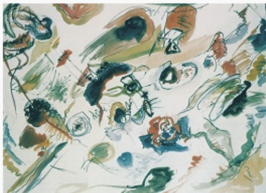
В. В. Кандинский. «Композиция». 1910. Национальный музей современного искусства (Париж).

формообразования и композиц. принципов, которые затем осуществлялись в архитектурных и предметных формах.