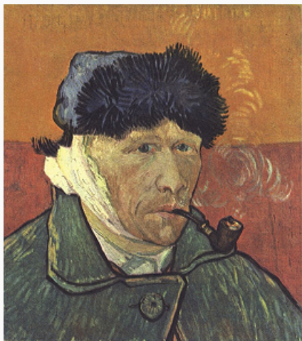
В. Ван Гог. «Автопортрет с перевязанным ухом». 1889. Собрание Ли Б. Блок (Чикаго).