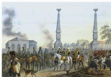
«Отступление французов из Москвы. В центре – Наполеон с генералами. У Калужской заставы, 19.10.1812». Художник К. В. фон Фабер дю Фор.

б. ч. кавалерии, оказалась серьёзно ослабленной. Кутузов, получив сведения о потерях рос. армии (44 тыс. чел.), отказался от продолжения сражения и отдал приказ отступать. Отходя к Москве, он надеялся отчасти восполнить понесённые потери и дать новое сражение. Но выбранная ген. от кав. Л. Л. Беннигсеном позиция у стен Москвы оказалась крайне невыгодной. С учётом того, что первые действия партизан показали высокую эффективность, Кутузов распорядился взять их под контроль Гл. штаба действующей армии, возложив руководство ими на дежурного генерала штаба ген.-л. П. П. Коновницына. На воен. совете в дер. Фили (ныне в черте Москвы) 1(13) сент. Кутузов приказал оставить Москву без боя. Вместе с войсками из города ушла б. ч. населения. В первый же день вступления французов в Москву начались пожары, продолжавшиеся до 8(20) сент. и опустошившие город. Во время нахождения французов в Москве партизанские отряды почти сплошным подвижным кольцом окружили город, не позволяя фуражирам неприятеля удаляться от него далее 15–30 км. Наиболее активными были действия армейских партизанских отрядов Д. В. Давыдова , И. С. Дорохова, А. Н. Сеславина и А. С. Фигнера .