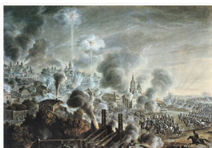
«Освобождение Вязьмы». Неизвестный художник. 1820-е гг.

действиях. Для них были закрыты пути в губернии южнее Москвы, не разорённые войной. Развёрнутая Кутузовым «малая война» ещё более осложняла положение неприятеля. Смелые операции армейских и крестьянских партизанских отрядов нарушали снабжение франц. войск. Осознав критич. положение, Наполеон I направил ген. Ж. Лористона в ставку рос. главнокомандующего с мирными предложениями, адресованными Александру I. Кутузов отверг их, заявив, что война только начинается и не прекратится до полного изгнания врага из России.