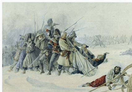
«Группа французских солдат обороняется от нападения казаков под Ошмянами. У больных и раненых отнимают тёплые вещи». Художник К. В. фон Фабер дю Фор.

Уцелевшая часть наполеоновской армии отступила к Смоленску, но запасов продовольствия и резервов там не оказалось. Наполеон I стал поспешно отводить свои войска дальше. Но в боях под Красным, а затем под Молодечно рос. войска нанесли поражение французам. Разрозненные части противника отходили к р. Березина по дороге на Борисов. Туда же на соединение с корпусом П. Х. Витгенштейна подходила 3-я Зап. армия. Её войска 4(16) нояб. заняли Минск, а 9(21) нояб. армия П. В. Чичагова подошла к Борисову и после боя с отрядом ген. Я. Х. Домбровского заняла город и правый берег Березины. Корпус Витгенштейна после упорного боя с франц. корпусом маршала Л. Сен-Сира 8(20) окт. овладел Полоцком. Переправившись через Зап. Двину, рос. войска заняли Лепель (ныне Витебской обл., Белоруссия) и нанесли поражение французам при Чашниках . С подходом рос. войск к Березине в районе Борисова образовался «мешок», в котором оказались окружёнными отступавшие