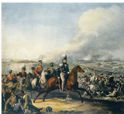
«Атака кавалерии Ф. П. Уварова под Бородином». Художник А. О. Дезарно. 1810-е гг.

По характеру воен. событий в О. в. выделяются 2 периода. 1-й период – от вторжения франц. войск 12(24) июня до 5(17) окт. – включает оборонит. действия, фланговый Тарутинский марш-манёвр рос. войск, их подготовку к наступлению и партизанские операции на коммуникациях противника. 2-й период – от перехода рос. армии в контрнаступление 6(18) окт. до разгрома врага и полного освобождения рус. земли 14(26) дек.