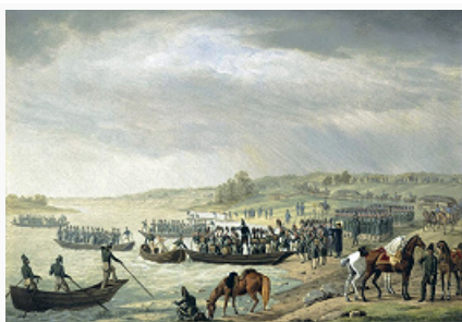
«Итальянский корпус Э. де Богарне переправляется через Неман 30.6.1812». Художник Альбрехт Адам.

группировках: 1-я Зап. армия (ген. от инф. М. Б. Барклай де Толли ; 6 пех., 2 кав. и 1 казачий корпус; ок. 128 тыс. чел., 558 орудий) составляла гл. силы и располагалась между Россиенами (ныне Расейняй, Литва) и Лидой; 2-я Зап. армия (ген. от инф. П. И. Баграмян ; 2 пех., 1 кав. корпус и 9 казачьих полков; ок. 49 тыс. чел., 216 орудий) сосредоточилась между реками Неман и Буг; 3-я Зап. армия (ген. от кав. А. П. Тормасов ; 3 пех., 1 кав. корпус и 9 казачьих полков; 43 тыс. чел., 168 орудий)